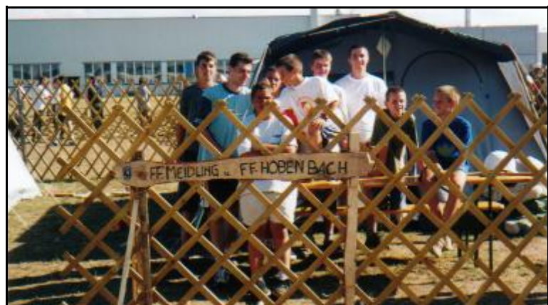
Jugendlager in Wr. Neustadt