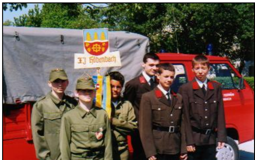
Versprechen der Feuerwehrjugend und Angelobung der Probefeuwehrmänner Florianiani 2000