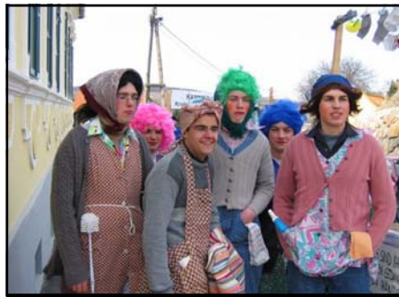
FF-Putztruppe beim Umzug

Besuch FF-Ball Paudorf, Faschingsumzug in Höbenbach