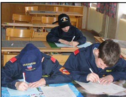
Wissenstest in Rohrendorf

Es folgten dann die Vorbereitungen für den jährlich wiederkehrenden Wissenstest und das Wissenstestspiel , die schließlich am 27. März 2004 in der Volksschule in Rohrendorf stattgefunden haben. Alle 8 daran teilnehmenden Jugendlichen haben den Test bestanden.