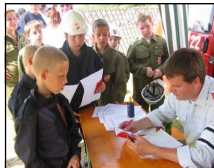
Selbständige Anmeldung unserer Teilnehmer beim Landesbewerb

Bevor es zum 32. Landestreffen der NÖ Feuerwehrjugend in Obersiebenbrunn ging, haben wir noch gemeinsam mit der Feuerwehrjugend Meidling einen Jugendbewerb im Bezirk Tulln mit großem Erfolg absolviert.