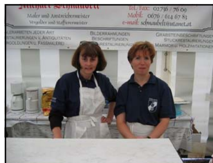
Zwei unserer guten „Geister“

Ein Riesenschritt zur Finanzierung wurde getan, aber bei weitem ist dadurch noch nicht alles finanziert.