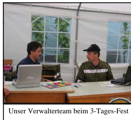
Unser Verwalterteam beim 3-Tages-Fest