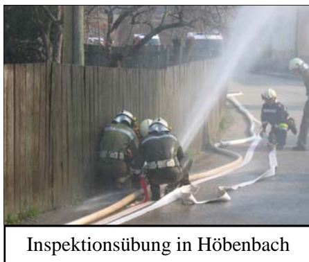
Inspektionsübung in Höbenbach

1 Personensuche in Meidling, 1 Tierrettung, 1 Hilfeleistung bei einem Verkehrsunfall, 2 Baumschlägerungen, 4 Transportdienste, 4 Schwimmbäder befüllen, 4 Wespen- bzw. Hornissennester entfernen, 3 Reinigungstätigkeiten, 2 Geräteverleihe, 4 Pumparbeiten