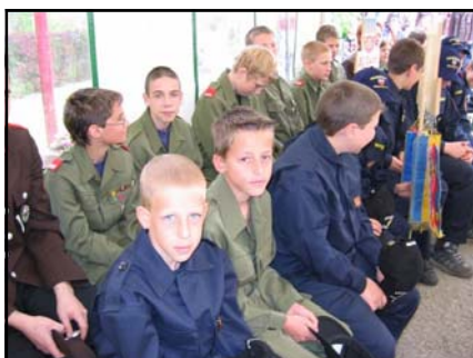
Unsere Jugend im Festpavillon