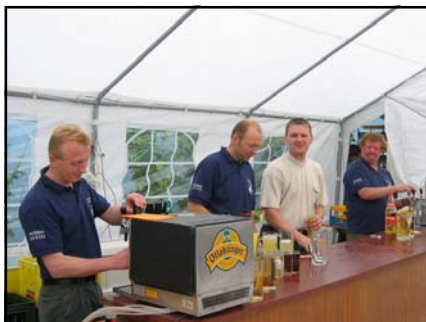
Profis am Werk

Unser Feuerwehrhaus wäre für ein Fest dieser Größenordnung zu klein und am Dorfplatz fehlen leider die nötigen strukturellen Voraussetzungen.