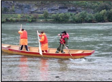
Erste Versuche in der Zille

Am 23. Oktober war es dann soweit, wir fuhren nach Oberarnsdorf und mit Hochspannung ging es mit den Zillen auf die Donau .