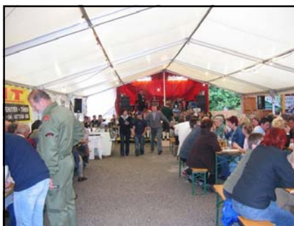
Feststimmung im Zelt

So möchten wir uns auf diesem Wege nochmals für das gezeigte Verständnis bei allen Bewohnern in der näheren Umgebung des Festgeländes bedanken.