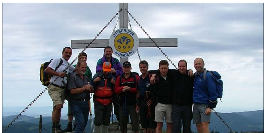
Unsere Kameraden vor dem Gipfelkreuz