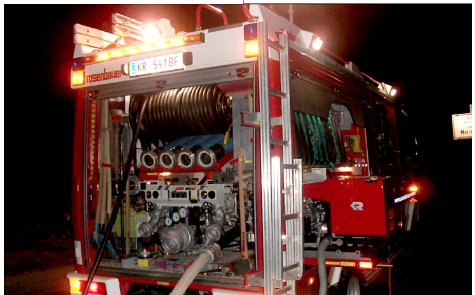
Einsatz bei Nacht mit dem Lichtmast und der Rundumbeleuchtung

Jugendliche zwischen 15 und 18 Jahren waren mit nur wenig vereinzelt Ausnahmen nicht mehr bereit, der Feuerwehr beizutreten. Mopeds oder Fernsehen waren wichtiger und möglicher Weise auch der Grund, keine Verpflichtungen zu übernehmen.