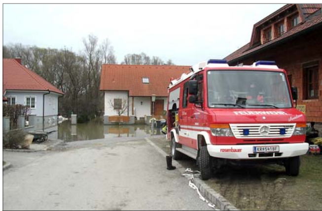
Unser Einsatzfahrzeug TLFA-1000 am Einsatzort.

Am 05. April 2006 in der Zeit von 04:45 bis 05:00 Uhr sammelten sich am Gelände der Feuerwehr Krems die Kräfte der 10. KHD-Bereitschaft ( K atastrophen- H ilfs- D ienst) für einen weiteren Hilfeinsatz im Bezirk GÄNSERNDORF.