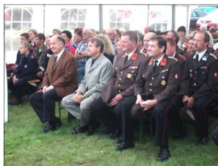
Die Ehrengäste bei der Feldmesse.

der Tagwache um 07:30 Uhr, einem Frühstück, einer so genannten Katzenwäsche und der