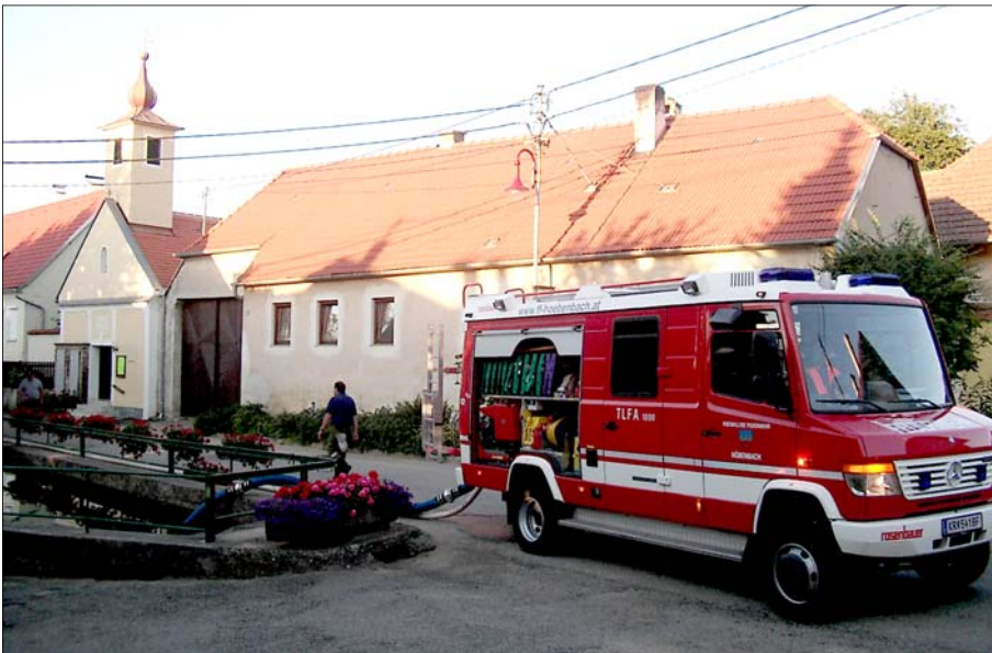
Wasserentnahme aus dem Löschteich am Dorfplatz mit dem TLF1000.

Eine Feuerwehrjugendgruppe besteht mindestens aus 9 Jugendlichen um auch an einem Mannschaftswettbewerb teilnehmen zu können. Weder in Höbenbach noch in Meidling konnte eine vollständige Gruppe gestellt werden, so stand von Anbeginn der Feuerwehrjugend in unseren (Fortsetzung auf Seite 2)