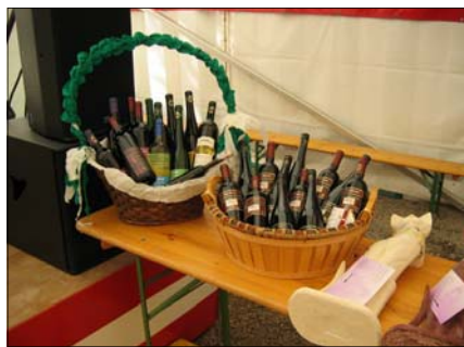
Großzügige Spenden für die Tombola.

Ich wünsche ihm für diese Arbeit viel Erfolg, er möge dabei aber seine eigene Feuerwehr nicht vergessen.