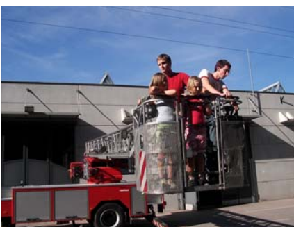
Die Drehleiter der FF-Krems.

Am Samstag ab 13:00 Uhr erfolgte das Beziehen der Zelte, am Nachmittag stand ein Besuch in der Feuerwehrzentrale in Krems auf dem Programm. Hier konnte sich ein jeder, der Mut hatte mit einer Drehleiter in die luftige Höhe von 30m heben lassen. Zurück