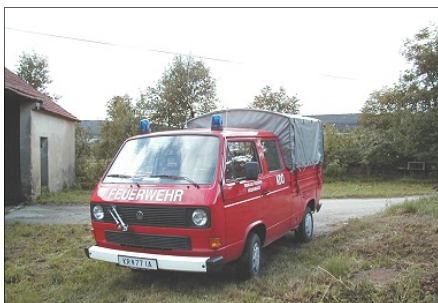
Unser Transporter mit Kabine.