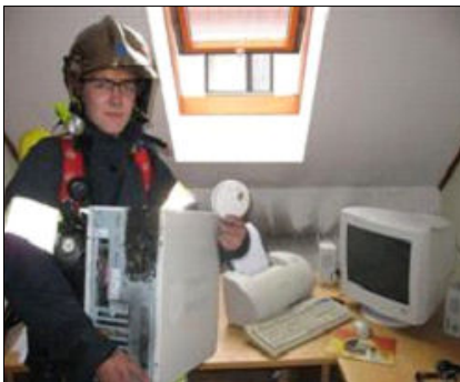
Rauchmelder-Alarm bei der FF-Krustetten im Büro!

Tipp: Zumindest in Schlafzimmer und Vorraum gehören die kleinen Helfer, besser auch