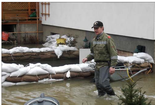
Abdichten der Garageneinfahrt mit Sandsäcken.

Gegen 20 Uhr wurden wir durch eine andere Feuerwehr abgelöst und wir fuhren müde aber wohl auf nach Hause. Alle eingesetzten Kräfte waren stolz darüber einer in Not geratenen Familie geholfen zu haben SCHEIBENPFLUG F., BI