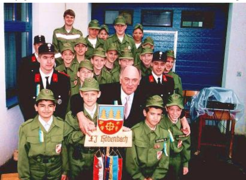
Landeshauptmann Dr. Erwin Pröll mit der Feuerwehrjugend des Unterabschnittes zu Floriani 2001

Das Landestreffen der NÖ. Feuerwehrjugend fand vom 5. - 8. Juli in Zeillern , Bezirk Amstetten, statt. 7 Jugendliche und 2 Betreuer konnten bei diesmal wunderschönem und sehr heißem Wetter die Zelte errichten. Der mitgenommene Getränkervorrat war bald aufgebraucht, sodass Nachschub notwendig war. Neben den Wettkämpfen wurden auch so manche Wasserschlachten mit Kübeln und Wasserbomben ausgetragen. Der Wasserverbrauch in diesem riesigen Zeltlager, welches in 4 Unterlager aufgeteilt war, nahm so große Ausmaße an, dass von der Lagerleitung das Wasser stundenweise abgedreht werden mußte. Der 10.000 Liter Tankwagen der Stadt Amstetten brachte mit dem Wasserwerfer gelegentliche Abkühlung und war für die Jugendlichen ein rießiger Spaß. So ganz ohne Zwischenfall, natürlich nur mit dem Wettergeschehen, gings auch