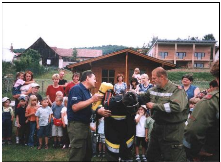
Brandschutzausbildung im Kindergarten Eggendorf

Privatrecht > technische Hilfeleistung jeglicher Art, wie vorhin angeführt, mit klar (Fortsetzung auf Seite 2)