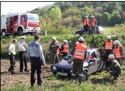
Verkehrsunfall am Göttweiger Sattel.

Nachfolgend ein grober Überblick über die wichtigsten Tätigkeiten im abgelaufenen Jahr: