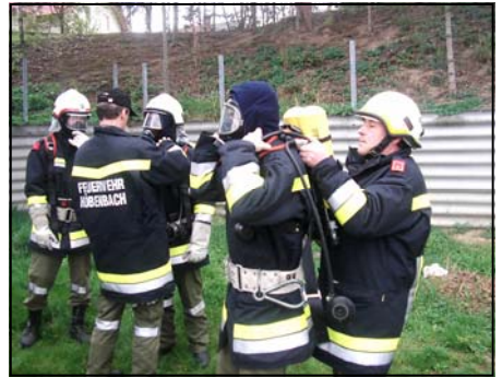
Ausrüsten des Atemschutztrupps.

versorgungen, 2 x Bäume umschneiden, 4 Pumparbeiten, 10 Unwettereinsätze, 1 Sicherungsdienst, 1 Dachreinigung