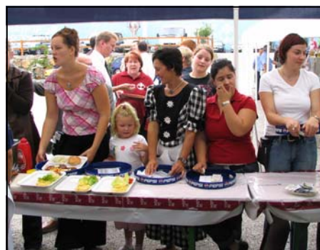
Einige freiwillige Helferinnen.

Im Namen der Freiwilligen Feuerwehr Höbenbach möchte ich mich bei der ganzen Bevölkerung von Höbenbach und Eggenendorf für alle Spenden und bei der Mannschaft mit ihren Frauen/Freundinnen für die Mit-