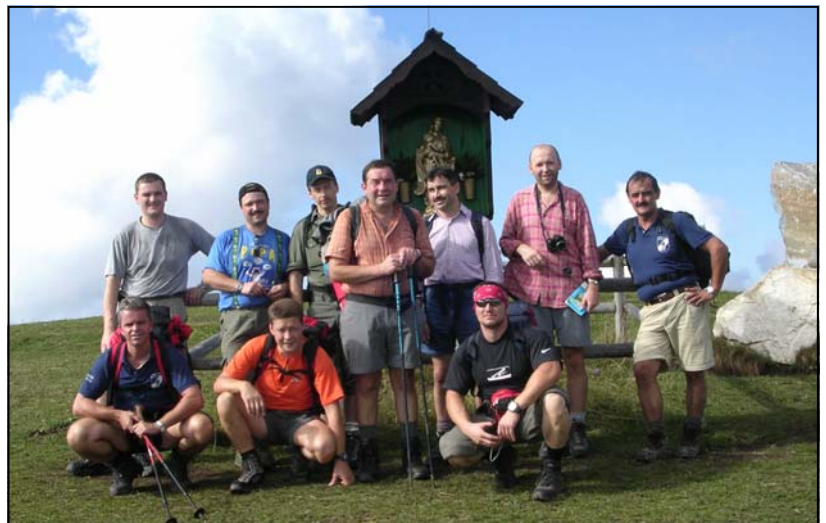
Das Gipfelfoto von der Reisalpe.